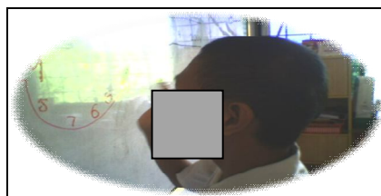
Rajah 3: Hans menyambung titik-titik di atas papan putih dengan pen marker

Langkah kedua yang saya ambil ialah menyediakan kayu sebagai pensel dan kotak yang diisi dengan pasir sebagai tempat menulis seperti yang ditunjukkan pada Rajah 4 manakala langkah seterusnya ialah meminta Hans menggunakan plastisin untuk membentuk nombor seperti yang ditunjukkan dalam Rajah 5.