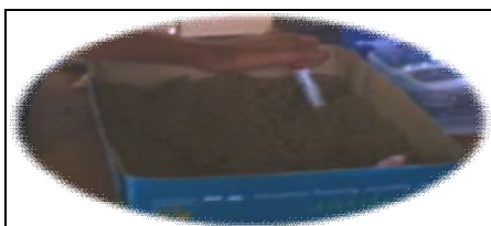
Rajah 4: Teknik pasir untuk mengatasi masalah menulis

Langkah kedua yang saya ambil ialah menyediakan kayu sebagai pensel dan kotak yang diisi dengan pasir sebagai tempat menulis seperti yang ditunjukkan pada Rajah 4 manakala langkah seterusnya ialah meminta Hans menggunakan plastisin untuk membentuk nombor seperti yang ditunjukkan dalam Rajah 5.