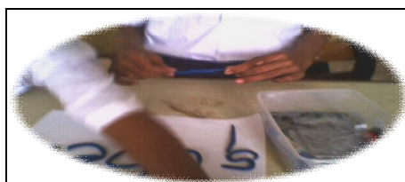
Rajah 5: Plastisin untuk membentuk nombor dan abjad

Langkah terakhir adalah menepak tulisan dengan menggunakan bahan bantu mengajar yang disediakan di sekolah seperti yang ditunjukkan pada Rajah 6.